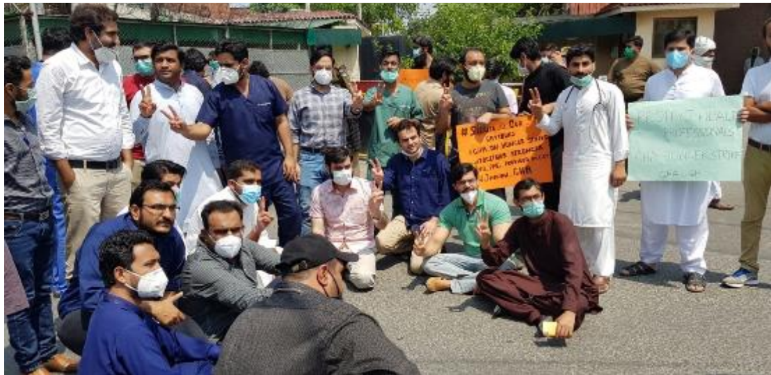
Médicos y personal sanitario de la Asociación de Profesionales Médicos Jóvenes protestan por la falta de equipos de protección individual y recursos y por las condiciones laborales en Pakistán, abril/mayo de 2020.

En diciembre de 2019, empezaron a llegar informes sobre una nueva enfermedad que más tarde fue bautizada como COVID-19. En marzo de 2020, la Organización Mundial de la Salud (OMS) declaró pandemia la propagación de la COVID-19. Cuando se redacta este informe, 11.125.245 personas han contraído la enfermedad y 528.204 han muerto como consecuencia de ella. 2 La mayoría de los países ha impuesto algún tipo de restricción a la libertad de circulación y a otros derechos humanos para controlar la propagación del virus. Es probable que varios países no hayan llegado aún a lo peor de la pandemia. No hay duda de que la pandemia de COVID-19 ha tenido un impacto físico, social y económico sin precedentes en las personas en todo el mundo. La población ha enfermado, ha perdido a familiares y seres queridos, y sus