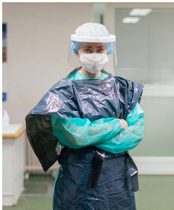
Enfermera de Urgencias (UCI) vestida con bolsas de basura y una mascarilla donada por una empresa privada en la entrada de Urgencias del hospital de San Jorge, 31 de marzo de 2020, Huesca (España).

La federación sindical de ámbito mundial Internacional de Servicios Públicos (ISP), que representa a 700 sindicatos y 30 millones de trabajadores y trabajadoras de todo el mundo, publicó el 11 de mayo de 2020 una encuesta realizada a sus miembros sobre los problemas que enfrentaban el personal sanitario y esencial durante la pandemia de COVID-19. Los resultados están basados en las respuestas recibidas de 62 países y territorios. Únicamente el 23,8% de los sindicatos que respondieron indicaron que las personas trabajadoras de la salud habían dispuesto de “EPI completos y se les habían repuesto” (el 57% dijo que no había sido así), y sólo el 14,1% de los sindicatos que respondieron indicaron que las personas trabajadoras que prestaban servicios públicos habían dispuesto de EPI adecuados (el 64,1% indicó que no había sido así). 40 Se encontraron variaciones sustanciales a nivel regional. Por ejemplo, en la región interamericana, el 69,7% de las entidades sindicales encuestadas afirmaron que las personas trabajadoras de la salud no tenían EPI adecuados, y el 76,1% afirmaron que las personas trabajadoras que prestaban servicios públicos y podían estar en contacto con personas contagiadas no tenían EPI adecuados. 41 En Asia, las cifras equivalentes fueron respectivamente de 50% y 51,4%. 42 La Confederación Sindical Internacional (CSI) realizó un estudio parecido entre sus miembros. Según el estudio, publicado el 28 de abril de 2020, “la