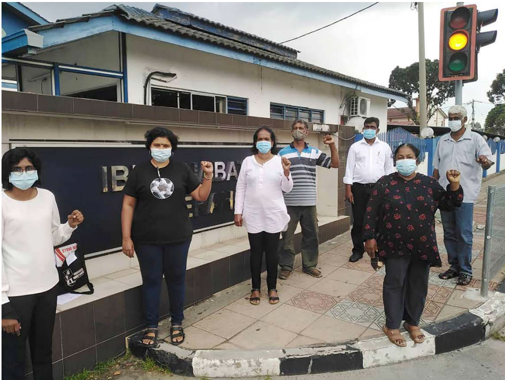
Miembros del Sindicato Nacional de Personal de Servicios de Apoyo a Hospitales y Otros Servicios Afines (NUWHSAS) tras su puesta en libertad después de una noche de detención. Lugar: Ipoh, Perak, 3 de junio de 2020.

Varios retos que afrontan actualmente el personal sanitario y los trabajadores y trabajadoras esenciales — muchos de los cuales se han detallado en este informe— son síntomas de problemas estructurales más generales de los sistemas sanitarios y de asistencia social que han quedado de manifiesto como consecuencia de la pandemia. Aunque el presente informe no puede explorar adecuadamente todos estos problemas subyacentes, este capítulo pone de relieve cuatro cuestiones principales que aparecieron una y otra vez durante la investigación para el informe.