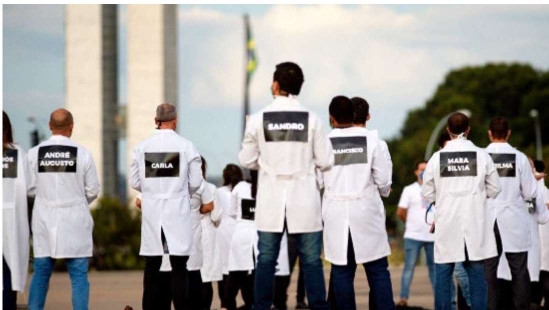
Profesionales de la enfermería rinden homenaje a enfermeros y enfermeras víctimas de la COVID-19 en Brasil, en medio de la pandemia de COVID-19, en el Museu da República de Brasilia, 12 de mayo de 2020.

enfermeras han fallecido como consecuencia. 7 Según los datos recopilados por Amnistía Internacional, actualizados a 5 de julio de 2020, más de 3.000 profesionales de la salud han fallecido de COVID-19 y otras causas relacionadas en 79 países y territorios de todo el mundo.